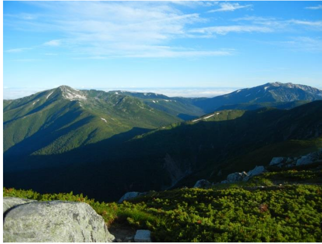
薬師岳(右)、黒部五郎岳(左)。