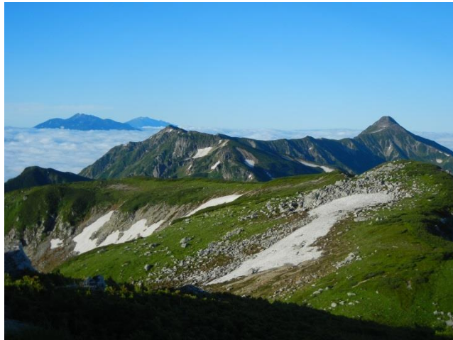
笠ヶ岳(右)。左奥は乗鞍、御嶽山。