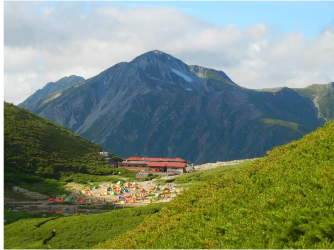
双六山荘。後方は鷲羽岳。